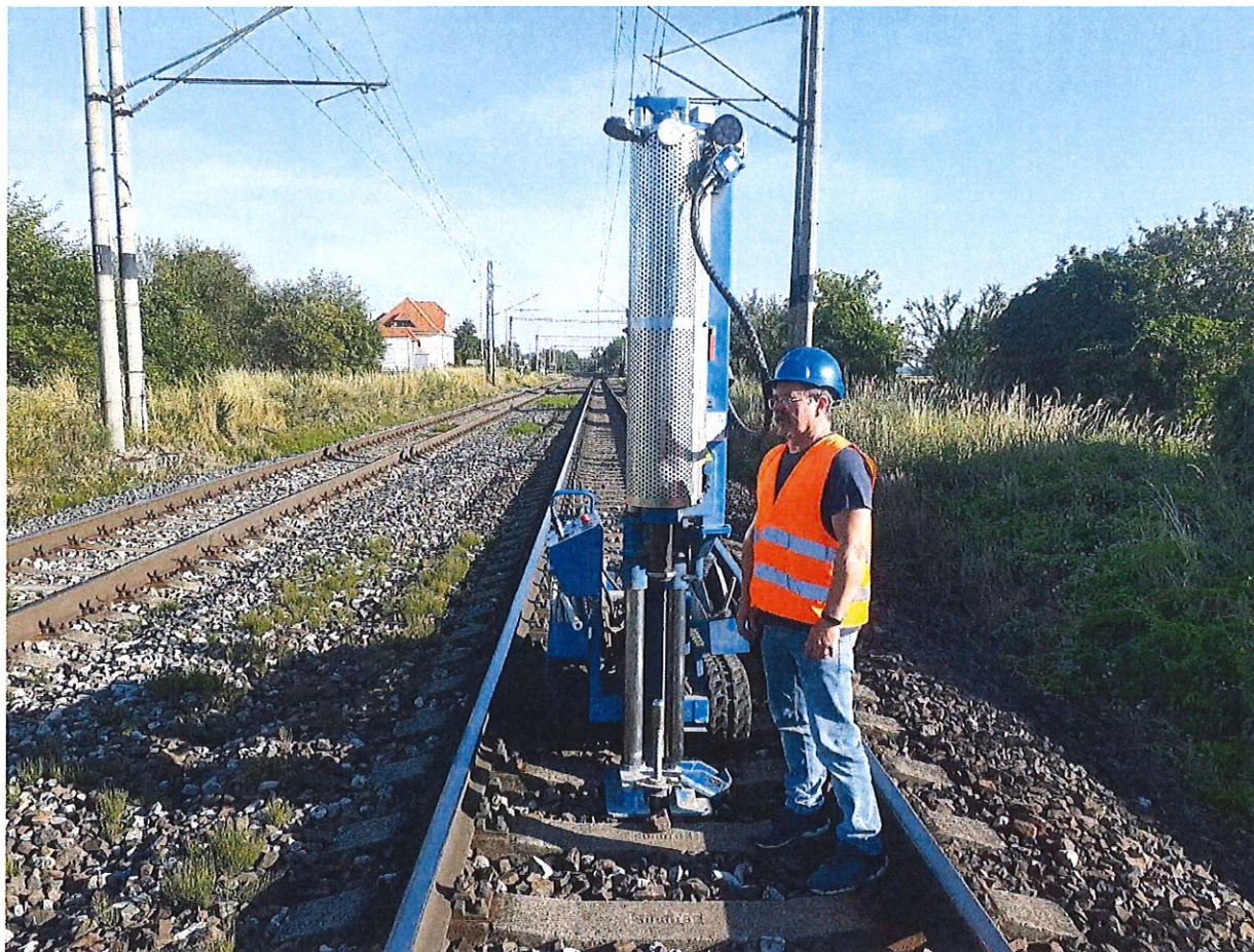
Doplňkový IGH prieskum, DPT – žst. Brodské, žkm 71,450